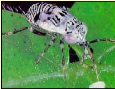
ਵੱਡੀ ਅੱਖ ਵਾਲੀ ਬੱਗ