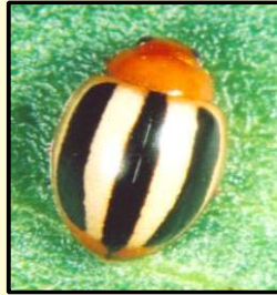
ਤਿੰਨ ਧਾਰੀ ਭੁੰਡੀ