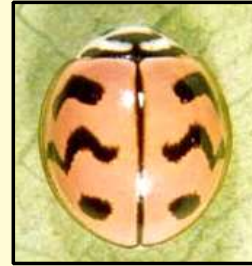
ਟੇਵੀਆਂ ਧਾਰੀਆਂ ਵਾਲੀ ਭੁੰਡੀ